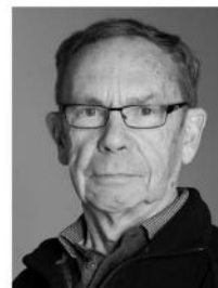
Buob Sepp 1941 Sakrale Räume

Als Fotograf versucht Ralf die Begeisterung für Natur, Sport, Architektur und Menschen auszudrücken. Die Idee entsteht in der Situation und werden mit Hilfe von Blende, Zeit und allen modernen mitteln in ein Bild umgesetzt.